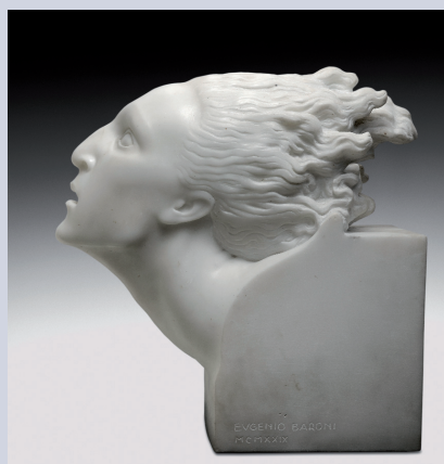
Eugenio Baroni, La Vittoria, 1929. Collezione privata